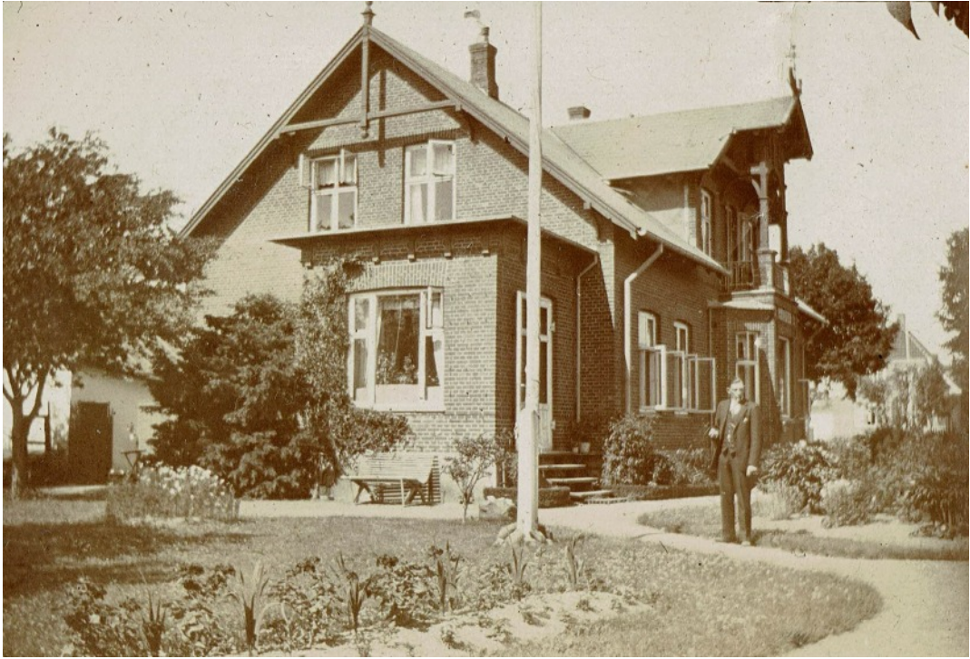
Villa Landro på M.D. Madsensvej 12 set mod Lillerød Station. Sommeren 1925 var åbenbart også varm, for alle vinduerne står på vid gab.