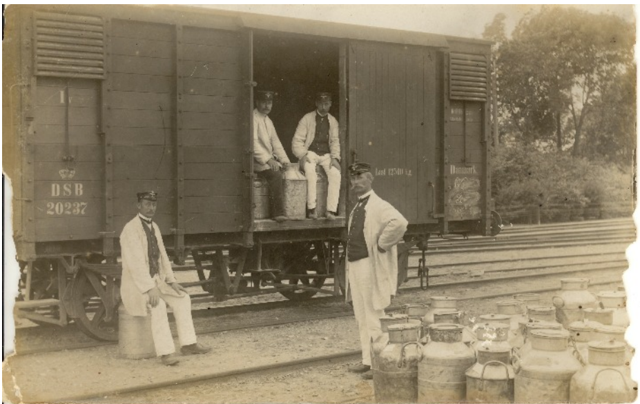
En godsvogn på Lillerød Station er enten ved at blive tømt eller fyldt med mælkejuger. Det har været tungt arbejde under alle omstændigheder. 1907.

- Hvordan var byens foreningsliv i de dage?