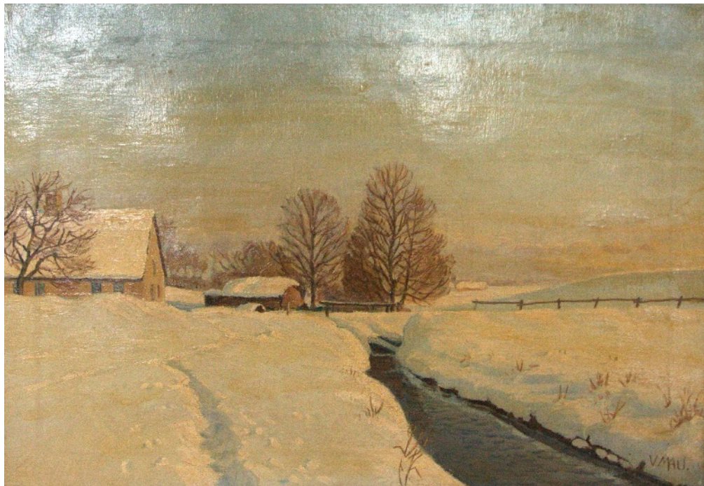
Maleri af Mølleåen ved den 2. Vandmølle - vi plejer at kalde den Hestetangsmølle. Både den og den øvre mølle er beskrevet i Lyngebogen, der kan findes på vores hjemmeside samt i Nøglehullet 2/2017.

egnen omkring Frederikssund og Lillerød/Allerød. Han var naturalist og lagde i sine billeder med landskaber, bøndergårde, møller og landsbymiljøer vægt på, så troværdigt som muligt at fastholde det set.