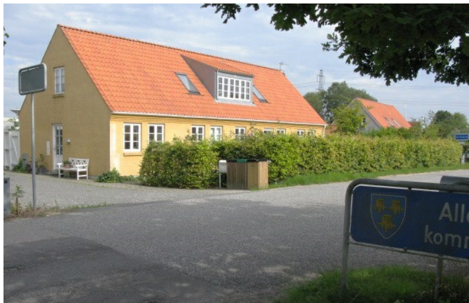
De nye huse på Hammersholt Byvej på Børstingerødsiden af kommunegrænsen passer fint ind i landsbystilen. 2009.

vellykket udbygning med tre nye landsbyhuse i Børstingerød, lukkede hullet langs byvejen ved kommuneskiltene mellem de to landsbyer, så bebyggelsen nu hænger tæt sammen. Og det kommunale tilhør har næppe betydet meget i hverdagen, - og meget praktisk havde Hammersholt til op i 1980'erne en købmand alle kunne bruge.