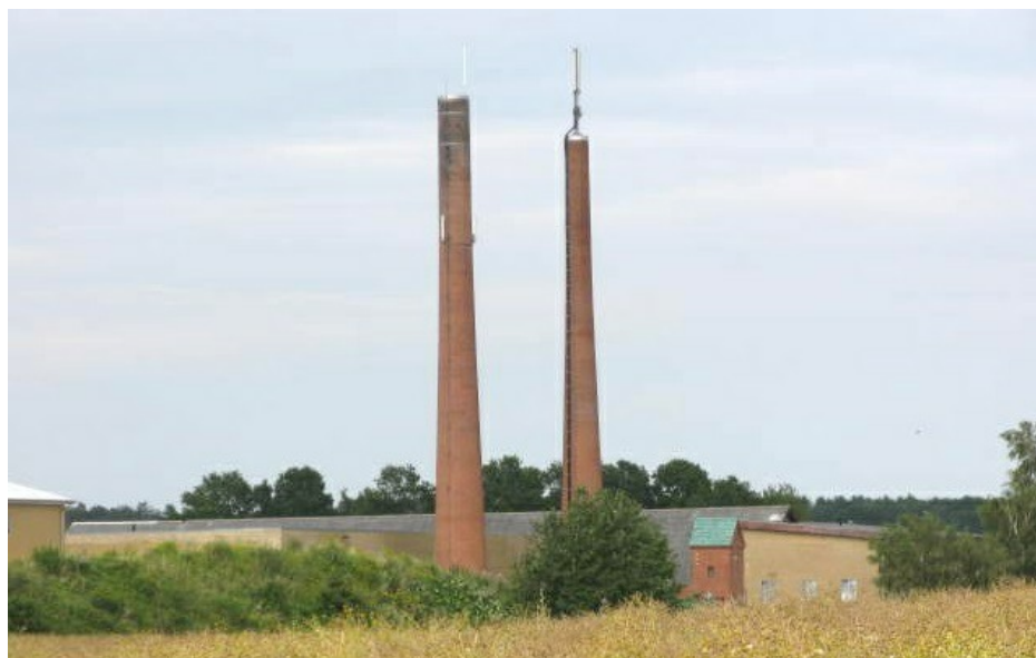
Hammersholt nye Teglværk med de to skorstene er idag en del af Hammersholt Erhvervspark. 2009.

Lynge og mange andre lokaliteter, - men faktisk handler teksten jo om Børstingerød. Lynge er blot herredsnavnet. At Børstingerød hører under Lillerød sogn nævnes ikke, og vi ved ikke meget om sogneinddelingen dengang - lige efter vikingetiden. Men Knud den Helliges gavebrev, hvori et par ejendomme fra Børstingerød foræres til domkirken i Lund, kan jo godt tænkes at flytte rundt på ejerforholdene helt op i tiden.