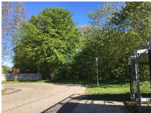
Bussernes vendeplads set mod nord med 'Lunden' i baggrunden og stationens cykelstativer til højre. 2018.