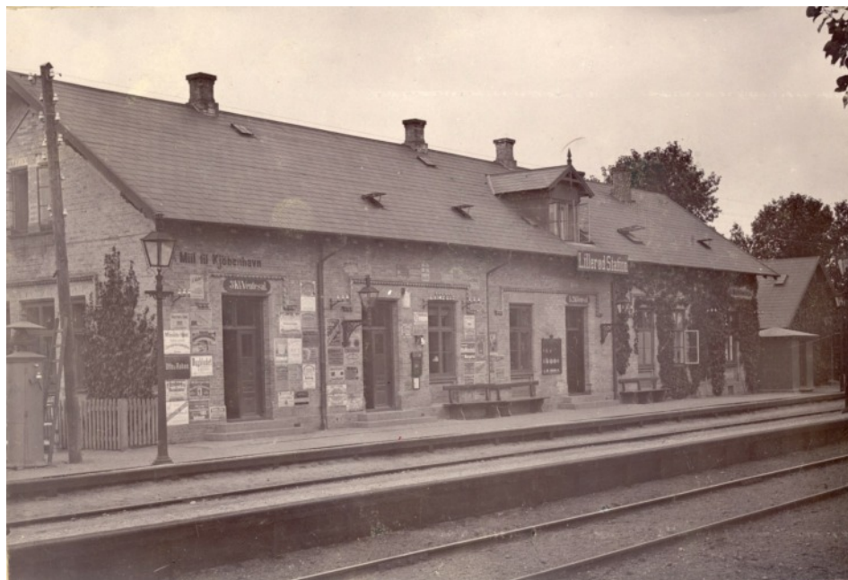
Lillerød Station med 3. classes ventesal til venstre og en masse reklameskilte på væggen. Før 1900.

- Jeg tror kun, der var Husflidsforeningen; den findes jo endnu, men af husfliden er kun navnet tilbage. Børnene havde dengang i deres fritid god beskæftigelse med at binde børster og flette kurve og den slags. Vores dreng gik om søndagen rundt og solgte børster for 10-12 øre stykket, og blev der 5 øre i fortjeneste, var han stolt af det! Nu har de unge jo fået andet at tænke på: gymnastik og fodbold og Teknisk Skole. Ikke fordi ungdommen var bedre i gamle dage, det var den såmænd ikke.