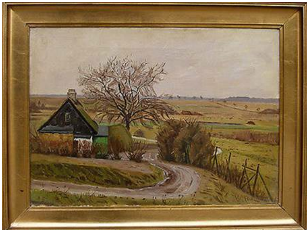
Et forårsbillede af Hestetangsvej nr. 204 med Farumvej/Ganløsevej i baggrunden. Igen helt åbent mod Farum.