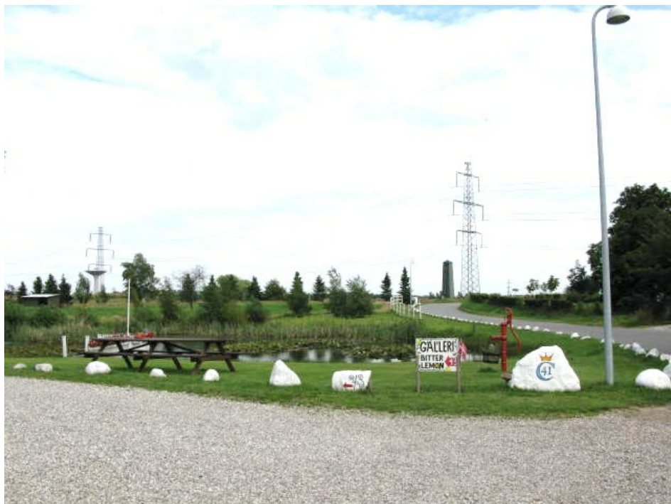
Gadekæret i Børstingerød set mod syd med Hammersholt Byvej til højre.