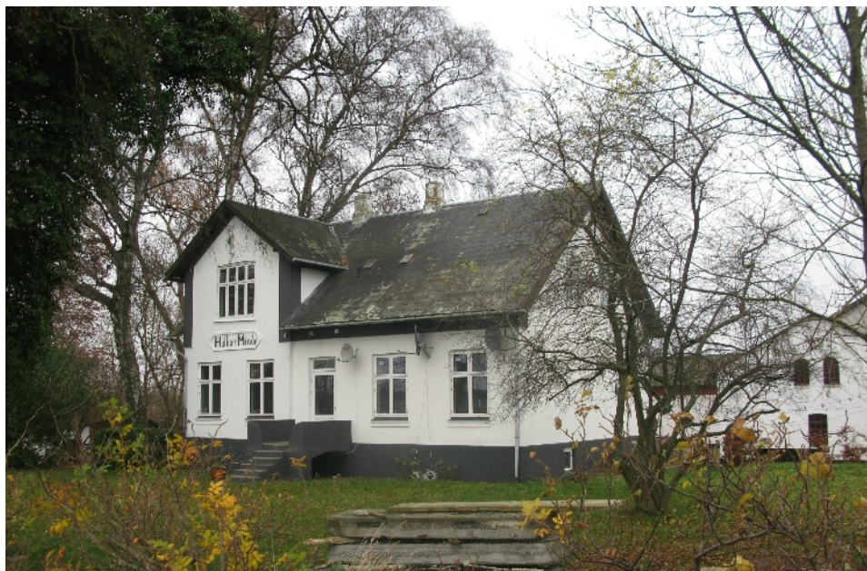
På skiltet med gårdnavnet står der "Hulhøjs Minde", men på geodætiske kort kaldes gården Hulhøjsminde. 2012.

I 1950 solgte Svend A. Hansen gården til Edle og Carl, med en besætning på '2 heste, 16 køer, 6 stk. ungvæg, 1 so, 6 fedesvin, 3