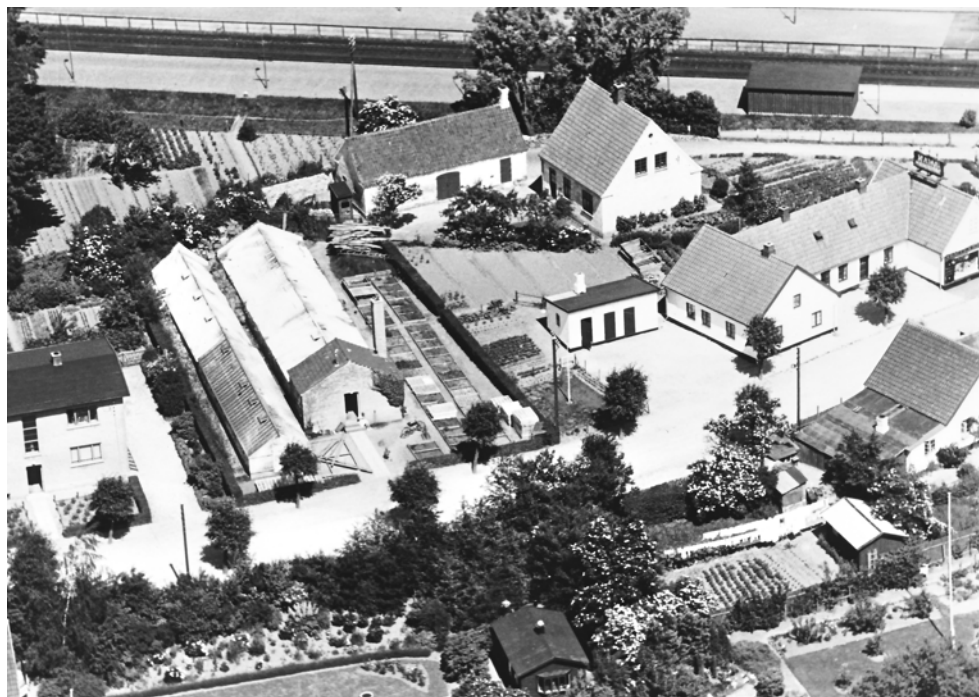
Mellem stationen og 'Lunden' har alle disse bygninger ligget på Rønne Allé og Allerød Stationsvej. Øverst ses jernbanesporene, og øverst i venstre side anes 'Lunden's yderste træ. Huset helt til venstre, Rønne Allé 6, ligger der stadig, mens gartneriet 'Drivhuset'/Allerød Blomster, Banehus 14 f (midt i billedet) og Paradisgården (th.) for længst er nedrevet. Rønne Allé er stadig en allé, da billedet blev taget omkring 1950.