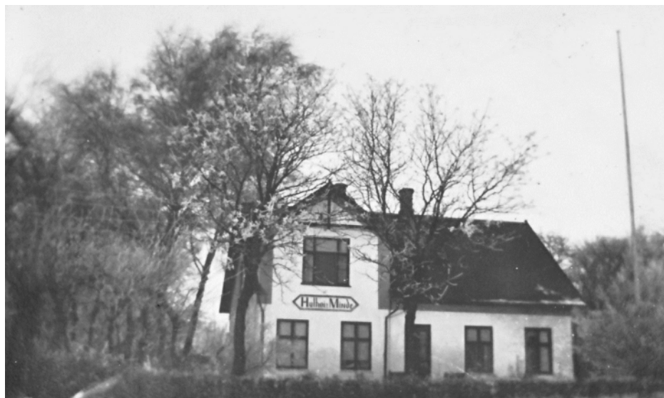
Navneskiltet med 'Hulhøjs Minde' er et gammelt skilt, der er blevet malet op mange gange. Gården er heller ikke forandret ret meget siden 1930'erne.

stuehus med lys og varme samt adgang til køkkenet med videre. 4 I skødet nævnes også, at der i 1906 blev tinglyst dokumenter vedrørende en 'skinnevej' hen