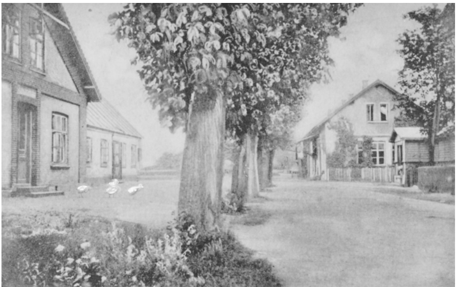
Lillerød Kro (tv.) lå skråt overfor stationsbygningen (th.). Kroen med gæssene foran blev erstattet af IRMA og senere Fakta, og nu er der genbrug. Før 1905.

stald. De to andre fik en skovfoged til at transportere dem hjem, og den ene blev ikke så lidt overrasket, da han fandt hest og kane velforvaret i stalden. -"Jeg kan forstå, at krikken kunne finde alene hjem," sagde han, "men at den også kunne spænde fra og få kanen på plads, det havde jeg alligevel ikke tænkt mig! Der findes ikke magen til hest i Danmark." Om en hest husker jeg også fra samme år en anden begivenhed. En mand havde hos købmanden købt et parti cigarer og lagt dem i hestens mulepose [så de ikke knækkede]. Han var i godt humør og tænkte ikke over noget, da han senere gav hesten posen på.