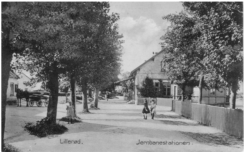
Lillerød Station th. da den senere Stationsvej havde allétræer. Omkring 1905.