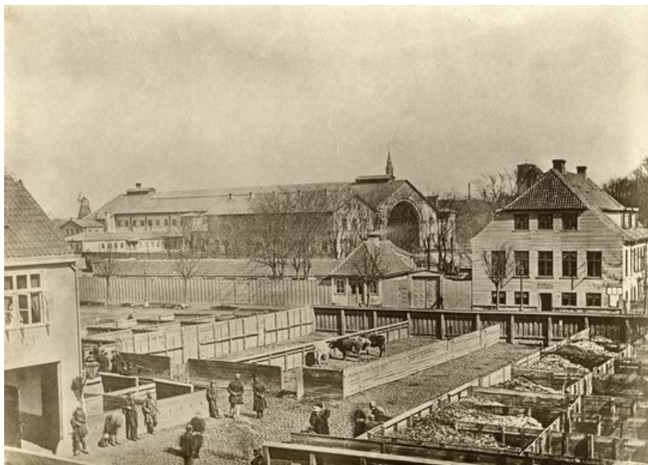
Den gamle Trommesal (tv.), der var hovedstadens kvægtorv frem til 1879. Når handlen åbnede skete det med trommehvirvler - deraf navnet. Den 2. Hovedbanegård fra 1864 ses i baggrunden. Omkring 1868.

I Lillerød manglede man dengang altid tomme godsvogne til de mange mursten fra teglværkerne og tørv fra Sortemosen, der skulle sendes til hovedstaden, men det hjalp noget på vognsituationen, at "man fra København sendte alt slags affald herud til aftømning i en udtømt grusgrav, der lå i stationens nordlige del. Her var begge stationens hoved-