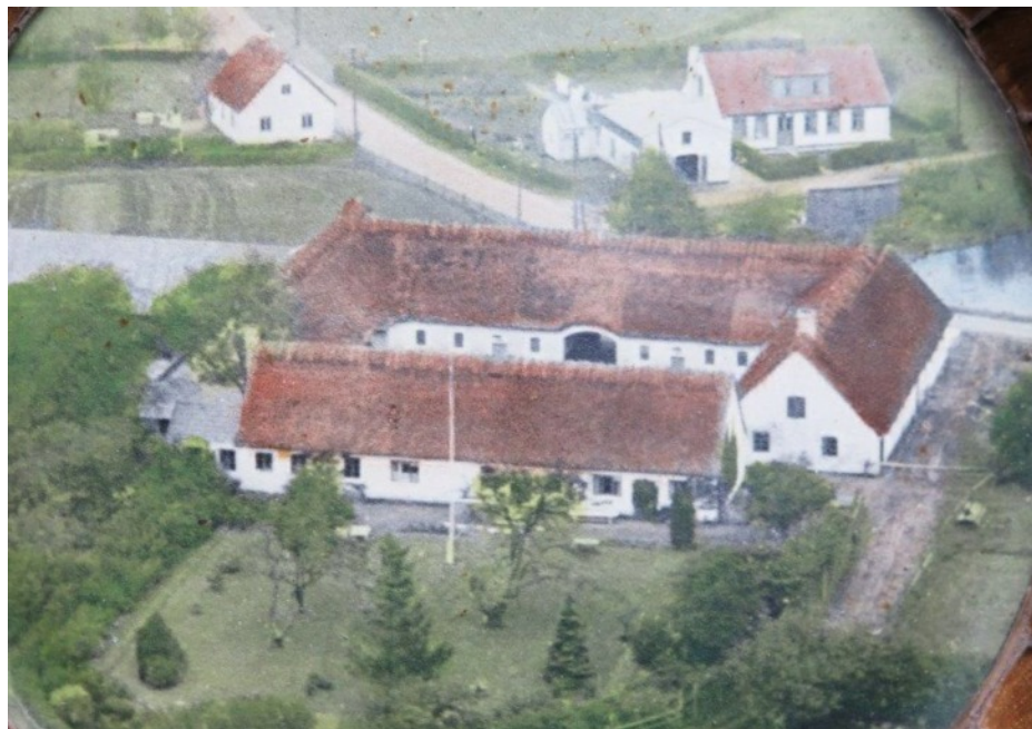
Damgården med Børstingerød Gadekær (Dammen) til højre og Damhuset øverst. Billedet er indsat i et askebæger, hvilket forklarer de runde kanter.