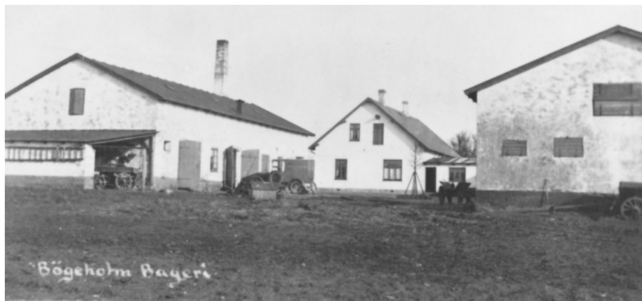
Bøgeholm Bageri var indrettet i længen til venstre med høj bageriskorst. I midten stuehuset.