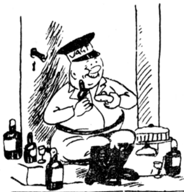
Vagtværnet i Lillerød forkæles hver Nat med Lagkage, Vin og Øl fra Borgerne.

Danmark atter blev et frit Land.” Efter at have hørt frihedsbudskabet i radioen samledes man og udbragte tre lange og tre korte hurraer for vort fædreland – ”og Skålen blev drukket i dejlig Vin.”