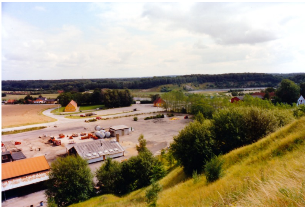
Pankas' bygninger ved 'Bjerget's fod i 1991. Den nu nedrevne 'Vejerbod' ses midt i billedet (rød og gul) - næsten skjult bag træer.