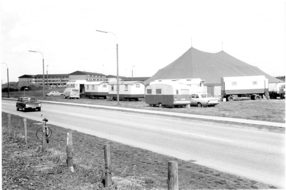
Cirkustelte og -vogne på Cirkuspladsen med Uglevang i baggrunden. 1973.