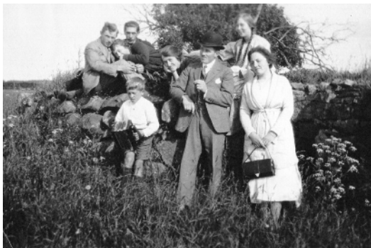
Udflugt fra Kirkehavegaard til møllefundamentet på marken, hvor Møllevænget ligger idag.

hus. Endvidere havde han på gården et værksted, hvor han selv forarbejdede alle træting til gården. Et lille savværk byggede han også, og senere en smedje, men smedehåndværket ville vist ikke rigtig gå.