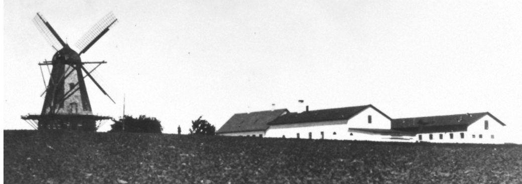
Bøgeholm Mølle ved siden af bageriet og gården. (Før 1920).