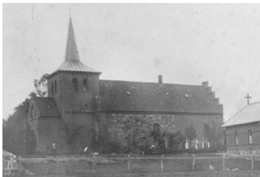
Lillerød Kirke før 1906.