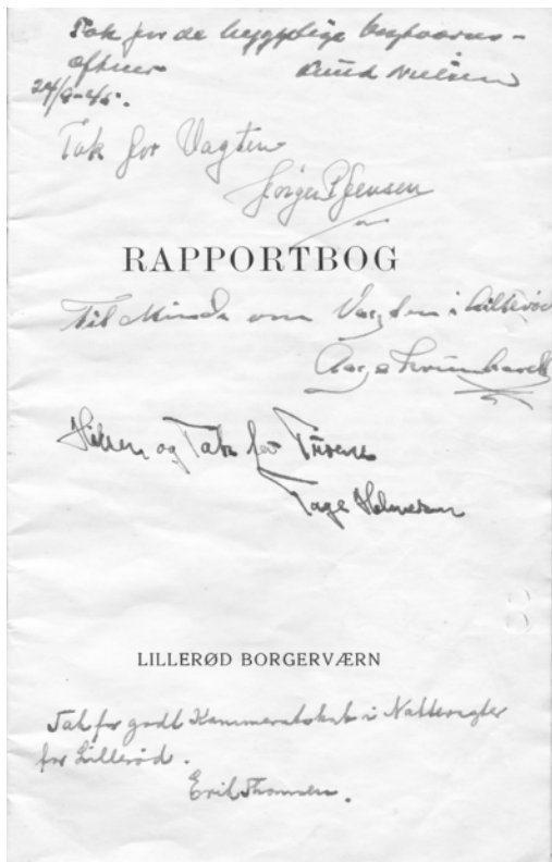
Forsiden af en af Arkivets Rapportbøger med hilsner fra afslutningsfesten den 24. September 1945.

så en vis Uhyggestemning, idet man var belavet på, at dramatiske Begivenheder kunne ske. Den danske Radio udsendte en vigtig meddelelse kl 24 om Dannelsen af en ny Regering m.m., og fra det Tidspunkt samledes vi om et dejligt Festbord i Vagtlokalet. Ædle Givere havde udstyret det med Snaps, Øl, Vin, Kager m.m., og vi drak igen Danmarks Skål og Vagtholdets og takkede hinan-