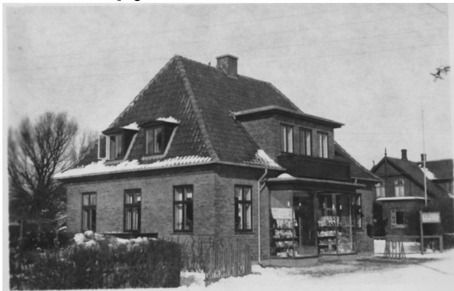
Lillerød Boghandel på M.D. Madsensvej 14 med håndkøbsudsalget fra Farum Apotek - omtrent, hvor MATAS ligger i dag. Th. ses nr. 12 'Landro', som nr. 14 er udstykket fra. (1930'erne)

Lillerød havde dengang knap 800 indbyggere, så en bog- og legetøjsforretning havde det svært, og derfor fik man hurtigt også et håndkøbsudsalg fra Farum Apotek. Imidlertid måtte apotekervarerne ikke være sammen med bø-