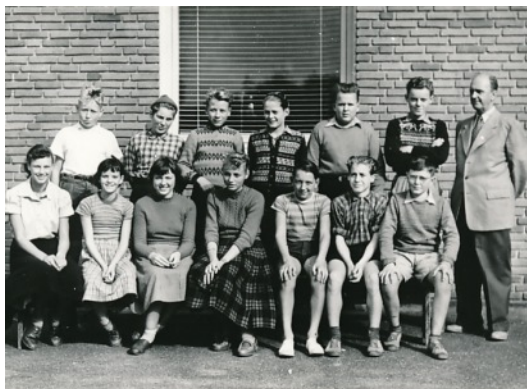
8. fri mellem på Lillerød Skole, 1953

Desværre har vi ikke så mange klassebilleder på Arkivet, så vi vil gerne låne og skanne, hvis I har nogle liggende. Efterspørgslen er stor.