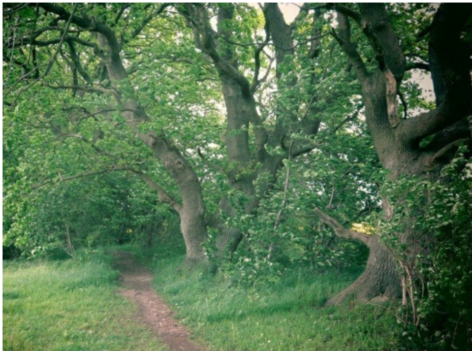
Lunden med de gamle ege, set fra sydøst.