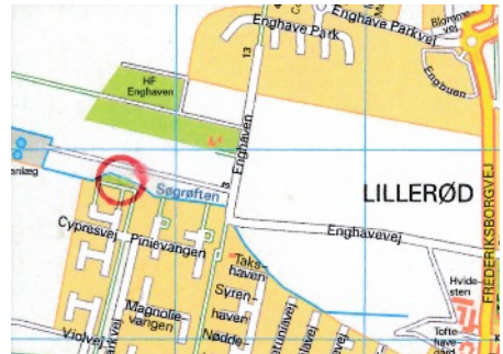
Lunden i Enghaven, - nutidigt kort.

sten blev overtaget af Statens Serum-institut i 1938. Der har aldrig været nogen kørevej derud, og nærmeste beboelse var landbrugsejendommen Kistedyssehus, oprindeligt Toftehavegaards husmandslod. Det kan ikke have været helt enkelt at bringe tunge støbematerialer til den sikkert hemmelige arbejdsplads, men trillebøre og hestevogne havde alle på landet vel adgang til. Og mere ved vi ikke, så hvis nogle af vores læsere har gode rygter