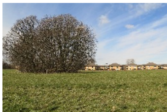
Kistedysse med Enghave Park i baggrunden.

Onsdag den 29. Marts 2017 kl. 19.30 på Kirkehavegaard