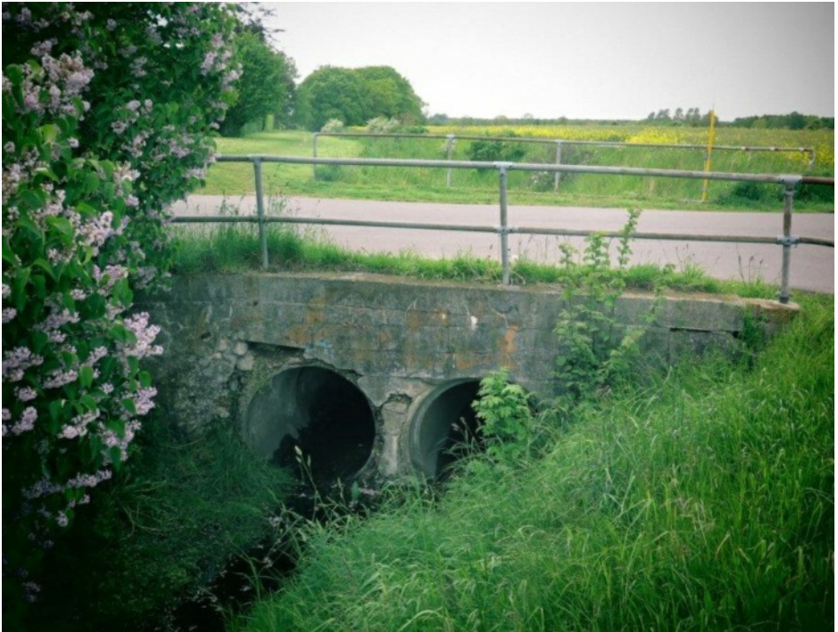
Søgrøften passerer under Enghavevej og fungerer stadig som åben vandledning. I baggrunden - over det venstre rør - ses lunden.

sten blev overtaget af Statens Serum-institut i 1938. Der har aldrig været nogen kørevej derud, og nærmeste beboelse var landbrugsejendommen Kistedyssehus, oprindeligt Toftehavegaards husmandslod. Det kan ikke have været helt enkelt at bringe tunge støbematerialer til den sikkert hemmelige arbejdsplads, men trillebøre og hestevogne havde alle på landet vel adgang til. Og mere ved vi ikke, så hvis nogle af vores læsere har gode rygter