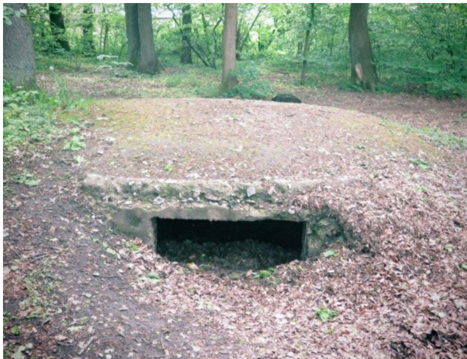
Bunkerens indgang vender væk fra den sti, der nu fører gennem lunden.

også har været skjult af træerne. I juni 2015 tog jeg derud med kamera og genfandt straks bunkeren i en svag jordhøj, uden dør eller afslørende detaljer. Næste dag tog jeg en tommestok med og målte det indre til ca. 160 x 300 cm og under en meter i højden, men rummet var fyldt med blade og skovbund, og kunne ikke måles rigtigt.