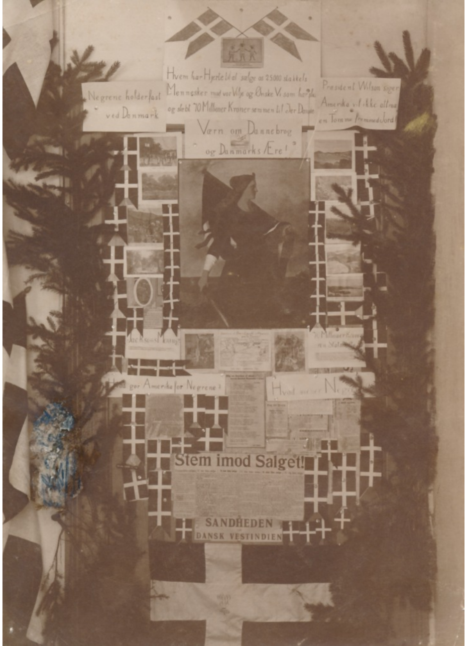
Den vestindiske Dør var pyntet med dannebrogsglag og grangrene. 1916.

til et skrift udgivet af Dansk vestindisk Samfund som indlæg i debatten om salget. Ved siden af fotografiet af døren