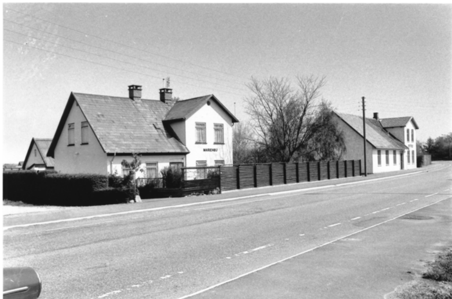
Mariehøj tv. og Bethesta i baggrunden. Ejendommene havde før adressen Lyngvej 210 og 208, men den er ændret til Sydkæret 4 og 6. (1980)

og snart var der ca. 40 børn i en af klasserne.