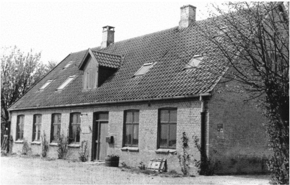
Kollerød Skole var en Rytterskole, men den blev ombygget i 1877. (1980)

for kommunens beboere efter Centralskolens indvielse, [1955] men på grund af det hastigt stigende børnetal ved skolen, benyttes den stadig som undervisningslokale.