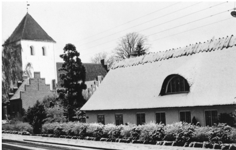
Lynge gl. Skole på Lynge Bygade 18 var skole fra 1819 til 1910. (Efter 1961)

vedskole, [Gl. Vassinerødvej 5] som ligger i Uggeløse sogn, og nu [1964] anvendes til bolig for lærere ved Centralskolen. Da skoleloven af 1937 fordrede,