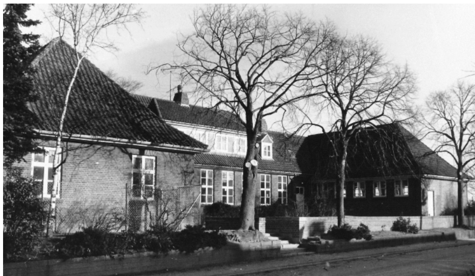
Lynge Skole, Ved Gadekæret 15 bygget 1910. (1985)

at undervisningstimernes antal forøgedes, fik man her alle tiders mærkeligste skoleordning, idet en stor del af børnene i skoletiden, uden at være under opsyn og i al