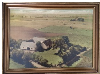
Højgård i Vassingerød.