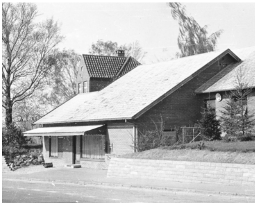
Lynges 'posthus' på Hillerødvej 13. (1968)

Med overflytningen af postekspeditionen fulgte en pakkeafhentningsordning hos købmanden i Nymølle, hvor beboerne i Nymølle senere kunne hente deres pakke hos købmanden, hvis de ikke var hjemme, når pakken kom.