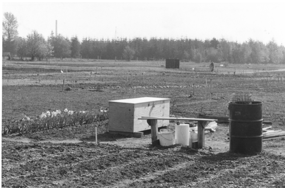
Nybyggerne i Enghaven er kommet i gang i jorden i de nyanlagte haver (1980), og på billedet nederst fejres foreningens tiårs-jubilæum (1990).