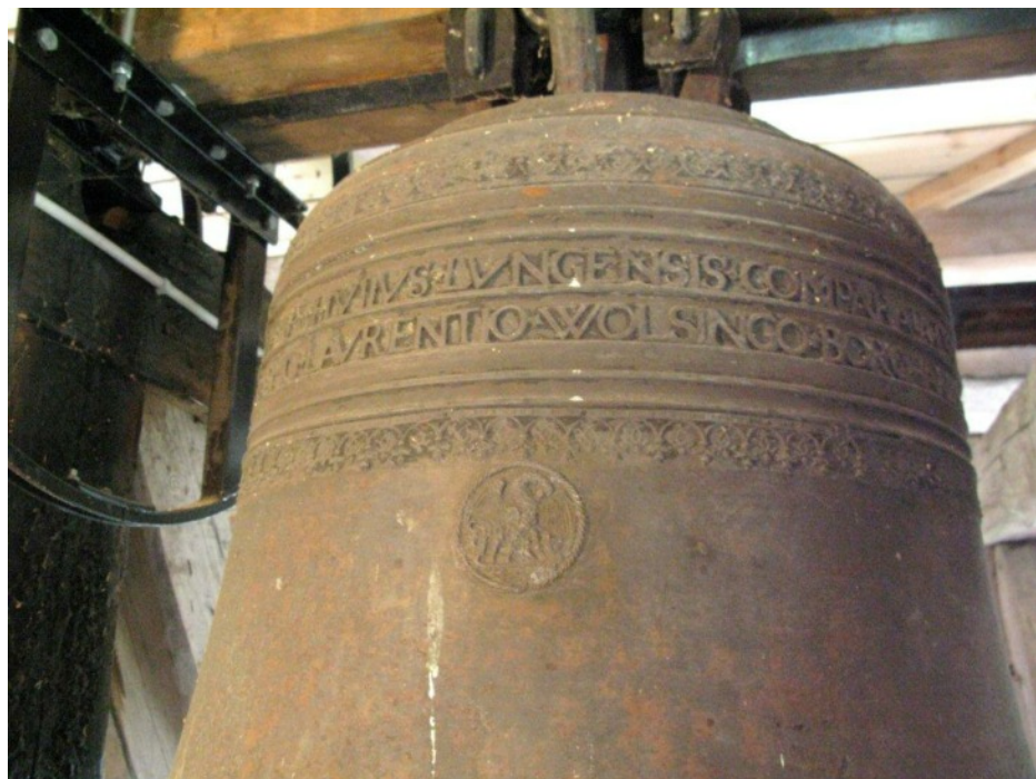
Klokken fra 1599 med den lange indskrift og et symbolsk relief af den opofrende pelikan, der fodrer sine unger med eget blod.

skolens bygning (d.v.s. Kollerød og Uggeløse Rytterskoler).