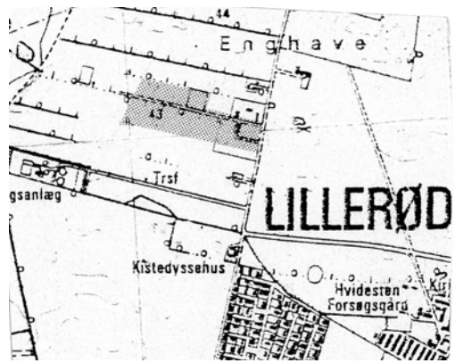
Haveforeningen Enghaven indsat på et kort fra 1974.