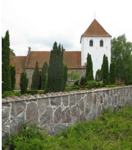
Kirken fra nord, relieffet er på vestsiden af tårnet.

ker, der hobede sig op på Københavns og Helsingørs kanonstøberier, og man kunne efterfølgende få lov til at tilbagekøbe en klokke, hvis den ikke var nået at blive omsmeltet.