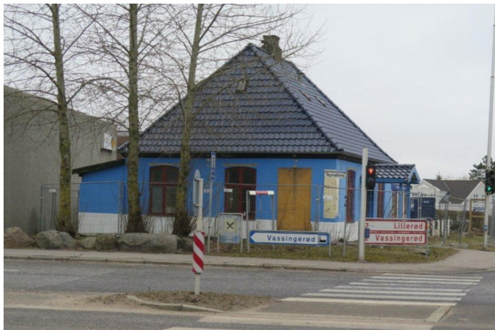
Et sidste blik på 'Vejerboden' 22.marts 2016

strede tilbygninger tjente det historiske hus som pizzeria eller restaurant, i perioder dækket af farverige plader og en overgang endog i italienske flagfarver.