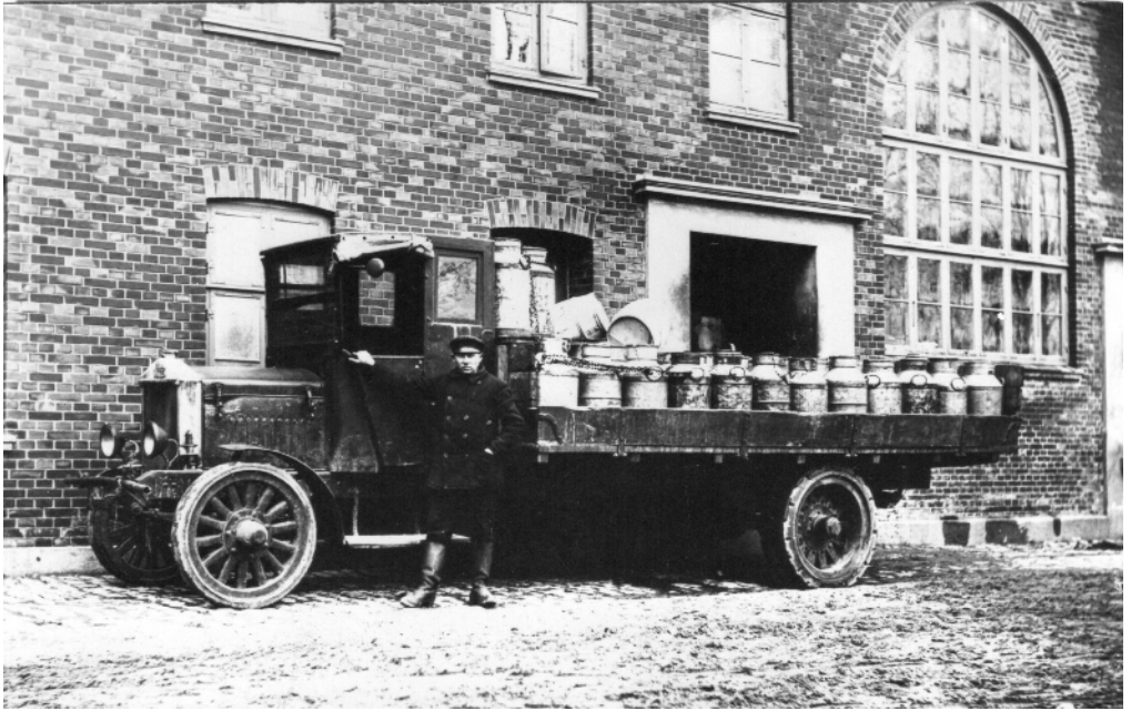
Andelsmejeriet Baunedal har her besøg af en mælkelastvogn fra Mejeriet Søholm mellem Fredensborg og Humlebæk, ca. 1920.

stødende Værelser. Alle Rum er møblerede af ham og forbeholdt ham, saa Grossereren må siges at have Bopæl på Ejendommen.” I en senere skrivelse fra grosserens sagfører, K.K. Steincke, står der, at ”det vilde være ham kært, om saavel Vejen fra Lyng Kro gennem Kollerød som Vejen fra Herløv [Nr. Herlev] kunde benyttes.” Sognerådet synes at have syltet sagen. Den omtales først indirekte i sognerådets mødereferat i maj 1917. Der står blot, at sognerådsformanden fik ret til at give enkeltvis tilladelse til bilkørsel. Så vi ved faktisk ikke, om