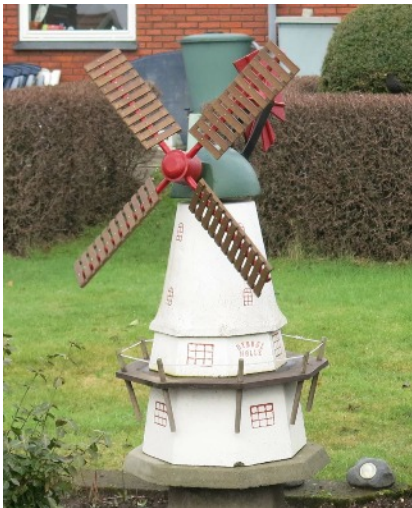
I en parcellushave på Rugvænget, tæt på, hvor Kirkehavegaards mølle lå, er opstillet en møllemodel!