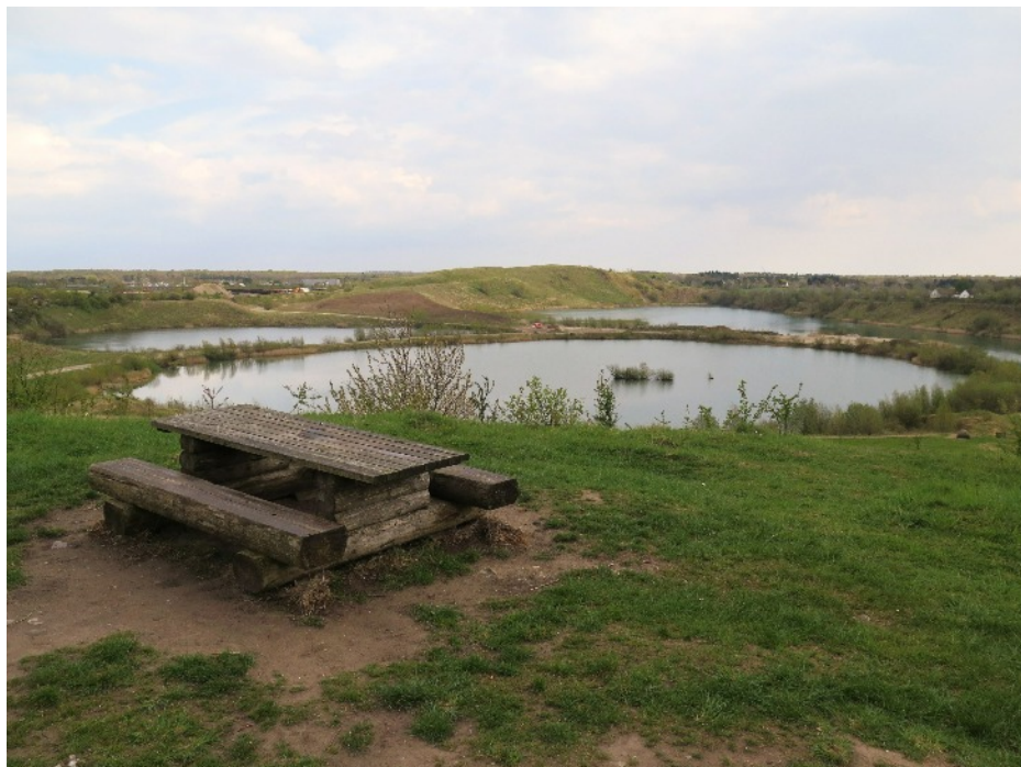
Udsigt fra Ringbjerget over søen mod 'Bjerget', jordbunken i baggrunden.

Der kan ventes forfriskninger undervejs.