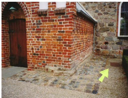
Uden for kirkedøren, - næsten i skammekrogen!

Men faktum er, at her er skolelæreren kommet "udenfor døren" – og oven i købet i "skammekrogen". □