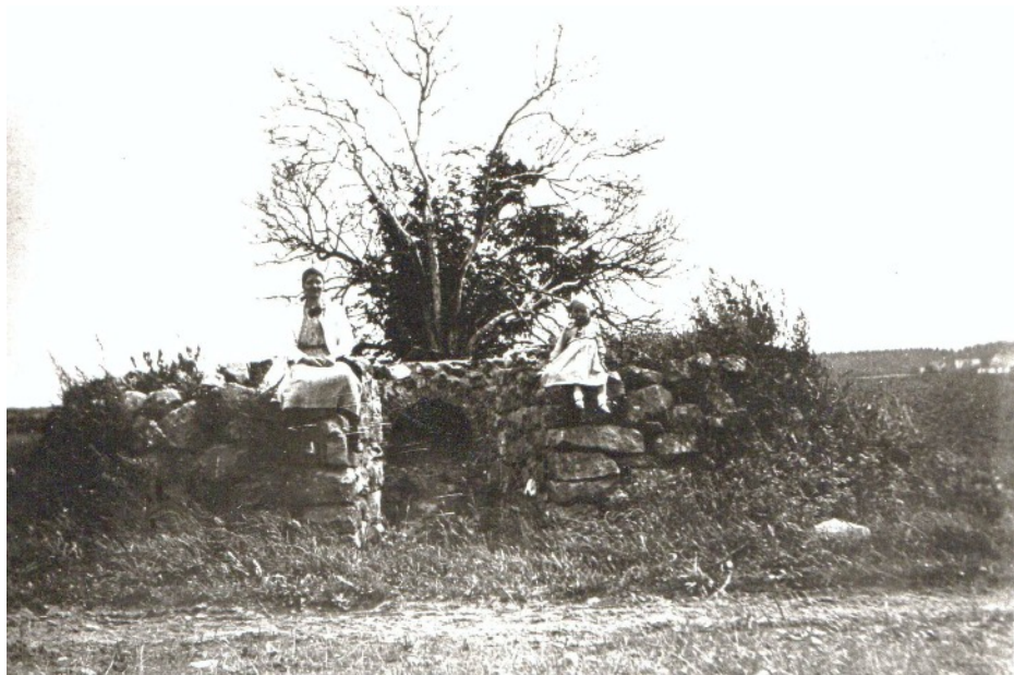
Møllefundamentet lå tilbage i flere år og var målet for nogle udflugter for familien fra Kirkehøvegaard.