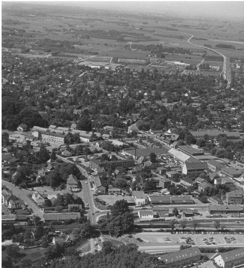
Luftfoto af Lillerød med Banevang og jernbanen i forgrunden og Amsvej, der går under viadukten og ind i billedet mod Biblioteket. Til venstre Pr. Valdemars Allé og th. MD Madsensvej. Kollerødvej snor sig øverst th. Midt '80-erne