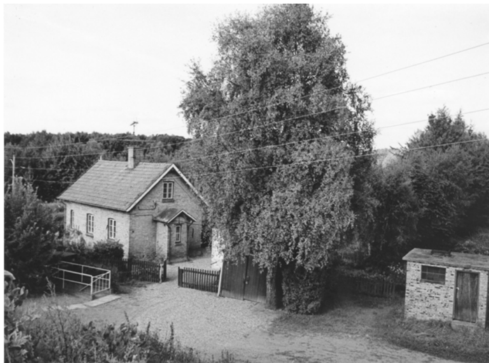
Det nu nedrevne banehus ved Hesselgårdsvej tv. med Høvelte Vandværks pumpehus th og nedgangen til vandværket bag den hvide låge.1982