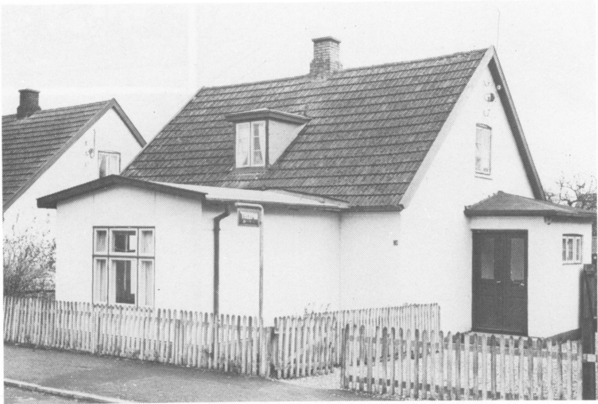
Telefoncentralen i Lillerød var, indtil automatiseringen for ca. 30 år siden indrettet i dette, endnu eksisterende, ydmyge hus på Fritz Hansensvej.