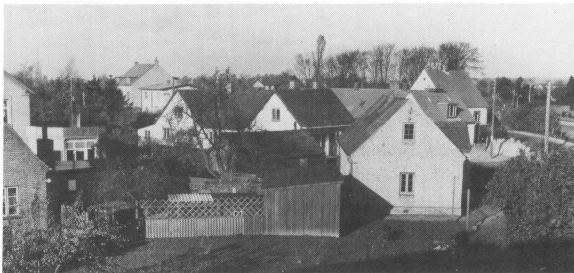
"Øen" ved Stationspladsen fotograferet af Gunnar Larsen i 1958 fra et vindue i ejendommen M.D.Madsensvej 1. Huset på "Øen" til højre, nærmest stationen, er et almindeligt banehus. Det andet, en rødstensvilla, var også beboet af banepersonale. Bagved ses ejendommen Paradisgården til højre og pendanten overfor med Rønne Allé imellem. Til venstre: "Villa Vito".