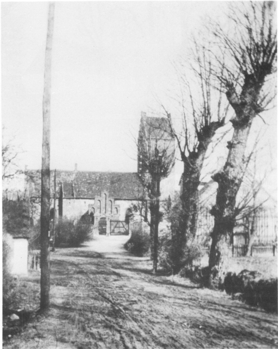
Lillerød kirke og Frederiksborgvej i 1920'erne. Frederiksborgvej var bygaden og ses her som opkørt jordvej, længe inden man begyndte at tjære vejene. Poplerne til højre står foran Kirkehavegård, hvis oprindelige indkørsel var den nærmest kirken. Til venstre gavlen af et gammelt stråtækt hus, der siden er erstattet af det nuværende, nydelige hvide teglhængte hus. Desværre findes ingen fotos af det første hus i arkivet. Endnu?