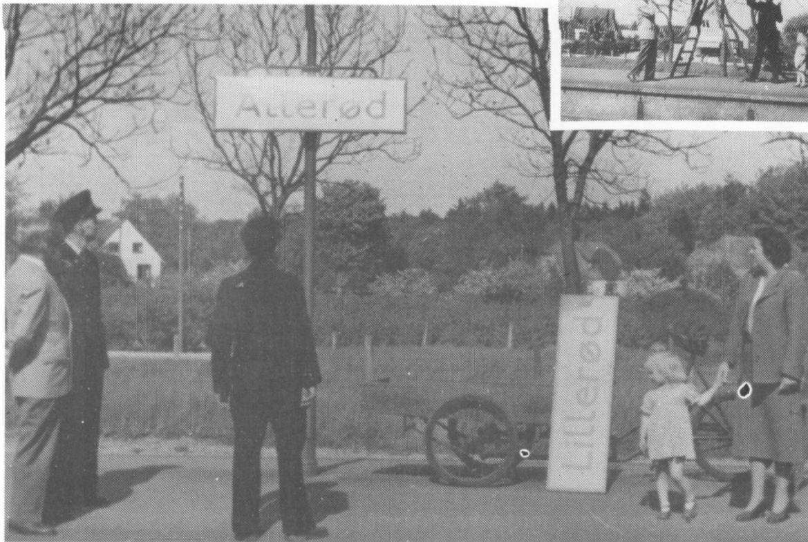
Sådan! 13.5.1952 udskiftedes stationens navneskilte, og fotografen har dækket situationen i et par optagelser, hvoraf dette er helt nyt for arkivet.