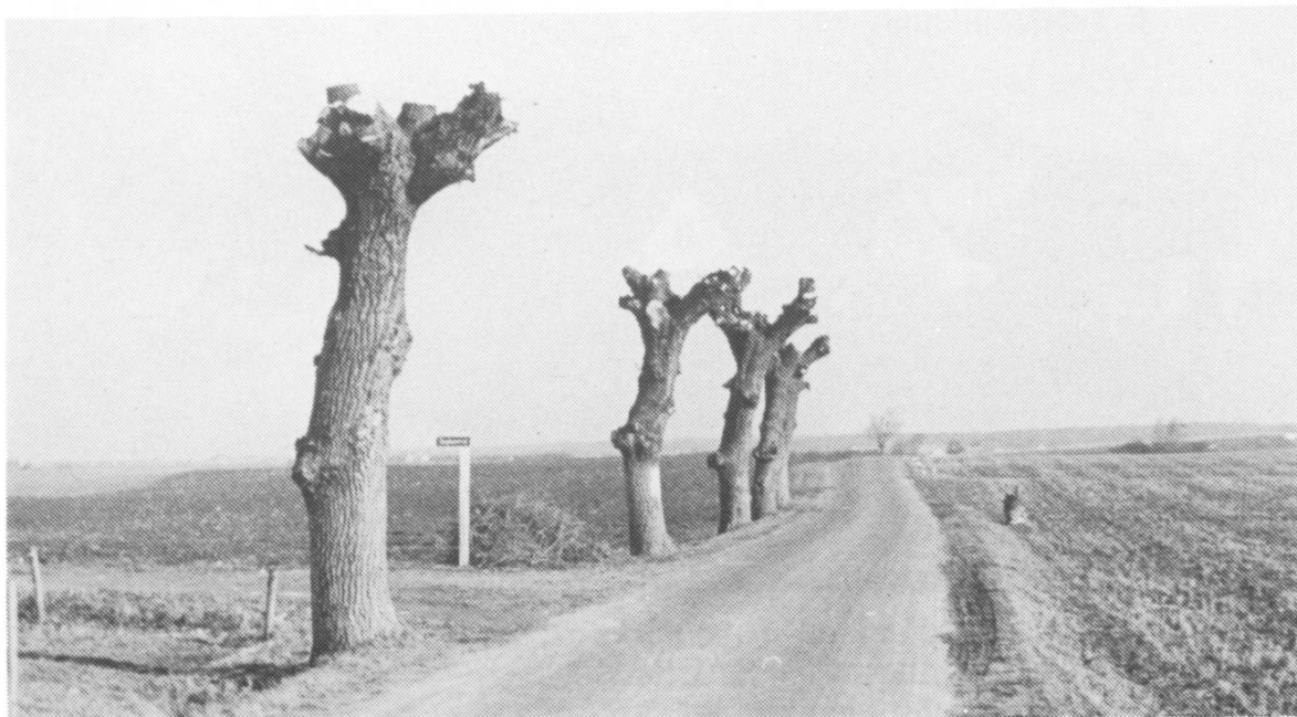
Den gamle landevej Frederiksborgvej, hvor Enghaven støder til nær Hvidesten. Billedet er udateret og før Rønne Allé og Mølle-vænget blev anlagt. Poppeltræerne faldt i slutningen af 40'erne.