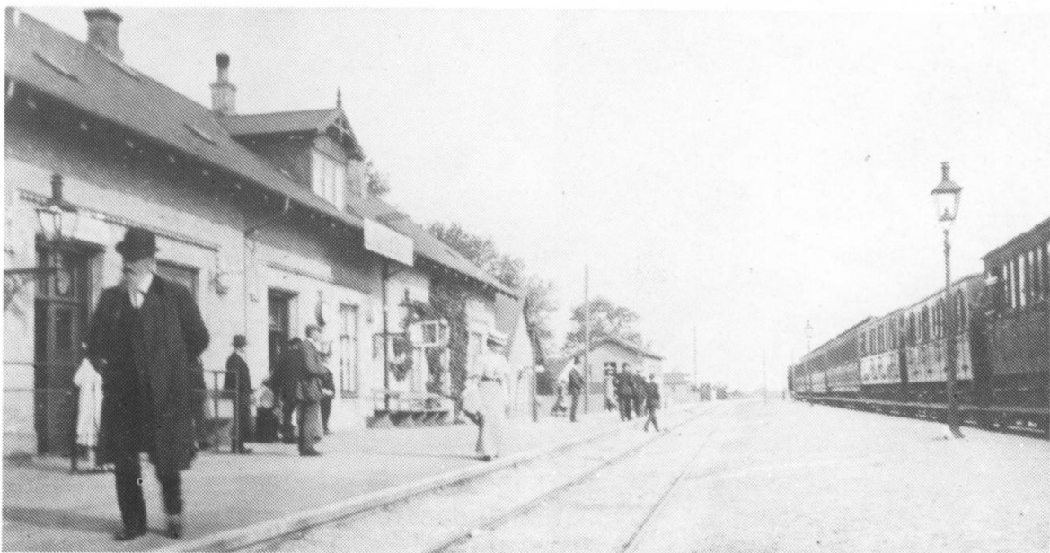
Lillerød station ca. 1909: Sporene ses helt tæt på stationsbygningen, og der er ingen perroner. Fotografiet kendes af mange, fordi det hang som fotostat i Sparekassen på M.D.Madsensvej.