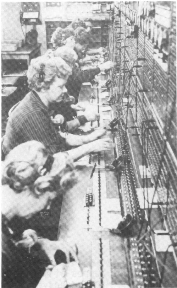
Indenfor ved centralens omstillingsbord. Centralen hed fra starten Allerød og ikke Lillerød, der kunne forveksles med Hillerød.