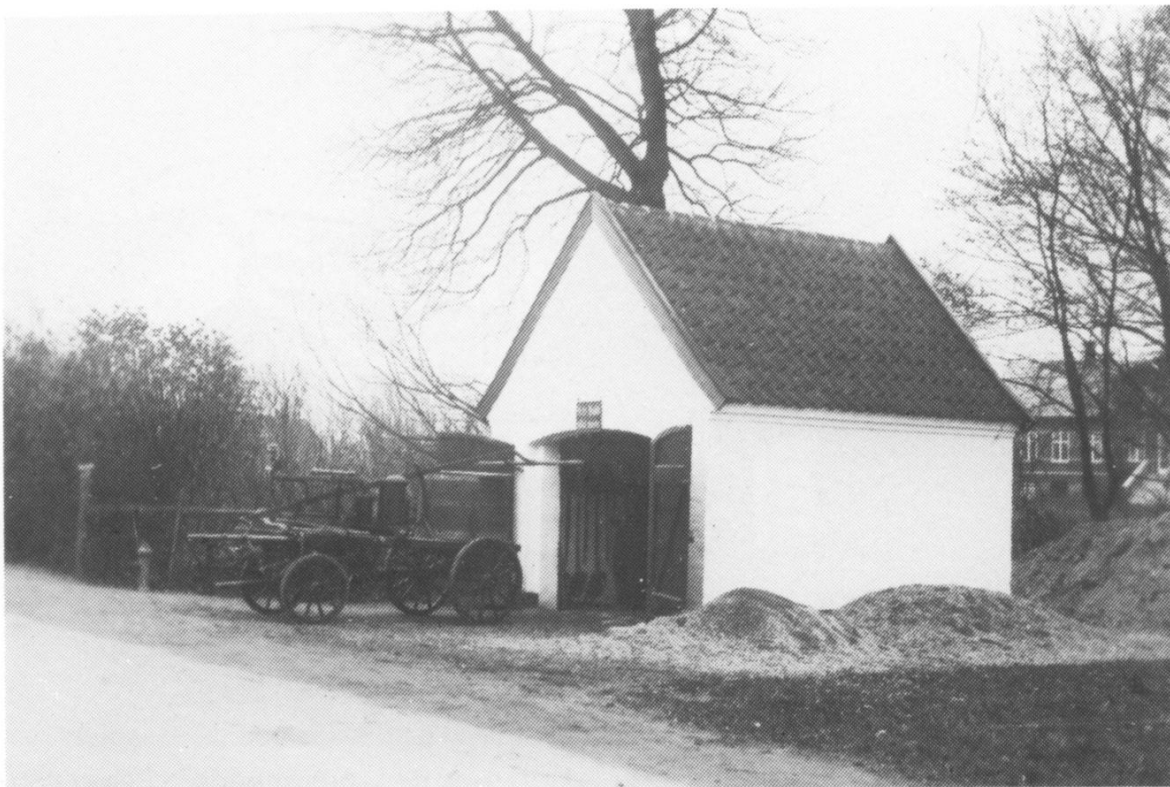
Lillerød Sprøjtehus ved Sprøjtedammen på Frederiksborgvej fotograferet før nedrivningen i begyndelsen af 1950'erne. Selve sprøjten er bevaret og deponeret hos Falck.