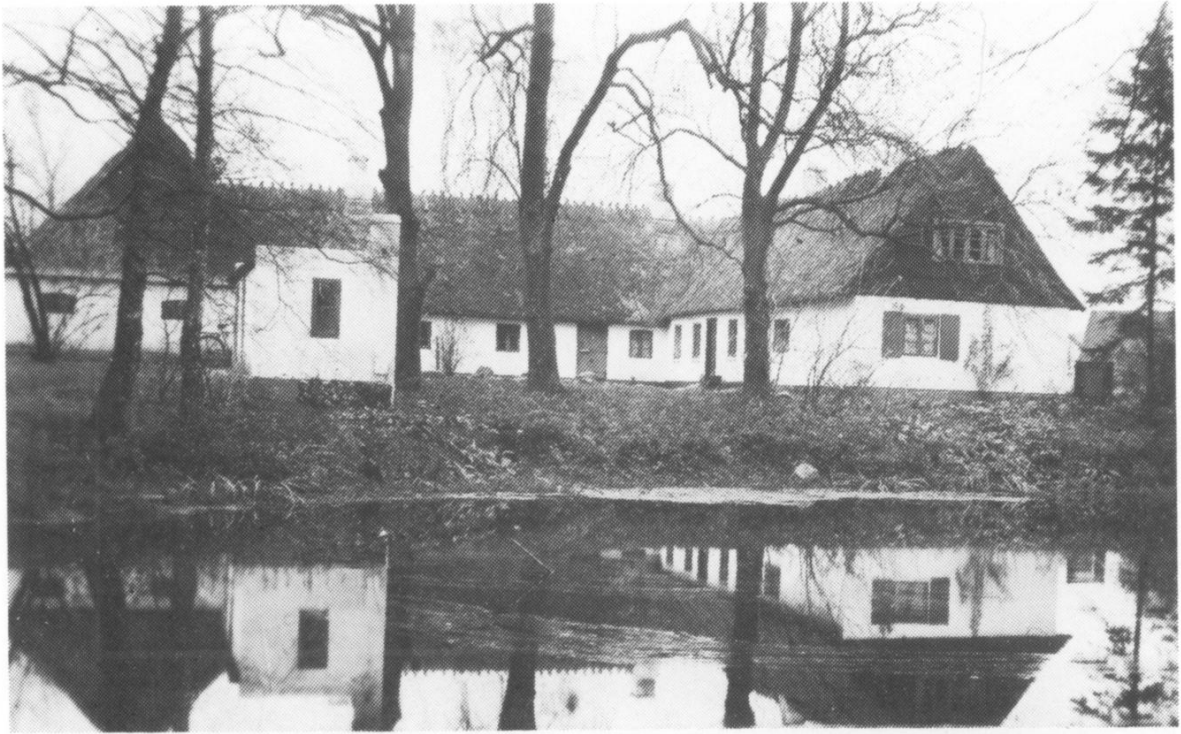
Sandholmgård på Sandholmvej i Horsemosen. Eksisterer endnu i samme stil som her (ca. 1950). Søen er nu fyldt op, hønsehuset nedrevet og i stedet er der bygget gule parcelhuse. Sandholmgård var sammen med Horsemosegård de eneste landbrugsejendomme i Horsemoseområdet.