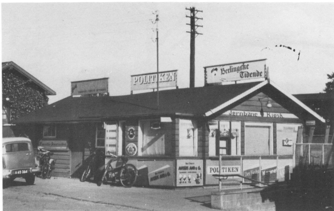
Stationskiosken lå i 1958 samme sted som den nuværende. Bemærk nedgangen og til venstre et 2-etages beboelseshus for jernbaneansatte.