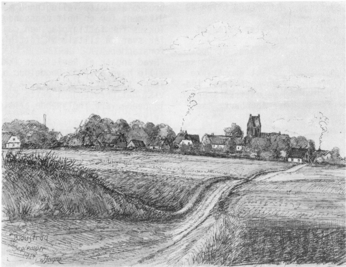
Farvelagt tuschtegning ,sign.J.Jensen : Bloustrød,september 1914. Man ser landsbyen fra en markvej vest for Kongevejen; i midten med skorstensrøg ses præstegården,yderst th (med røg):Kildebakkegård og til venstre anes møllens vinger og bageriets skorsten.

Lokalhistorisk Arkiv på Frederiksborgvej 59,Lillerød har åbent hver TIRSDAG kl. 9-13. Der er åbent hus hver første ONSDAG i måneden fra oktober-maj, samt efter aftale med arkivleder Birthe Skovholm formiddage man-tors på arkivets tlf : 42 27 08 91