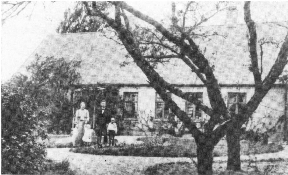
Haven og skolen omkring 1920 med lærerfamilien