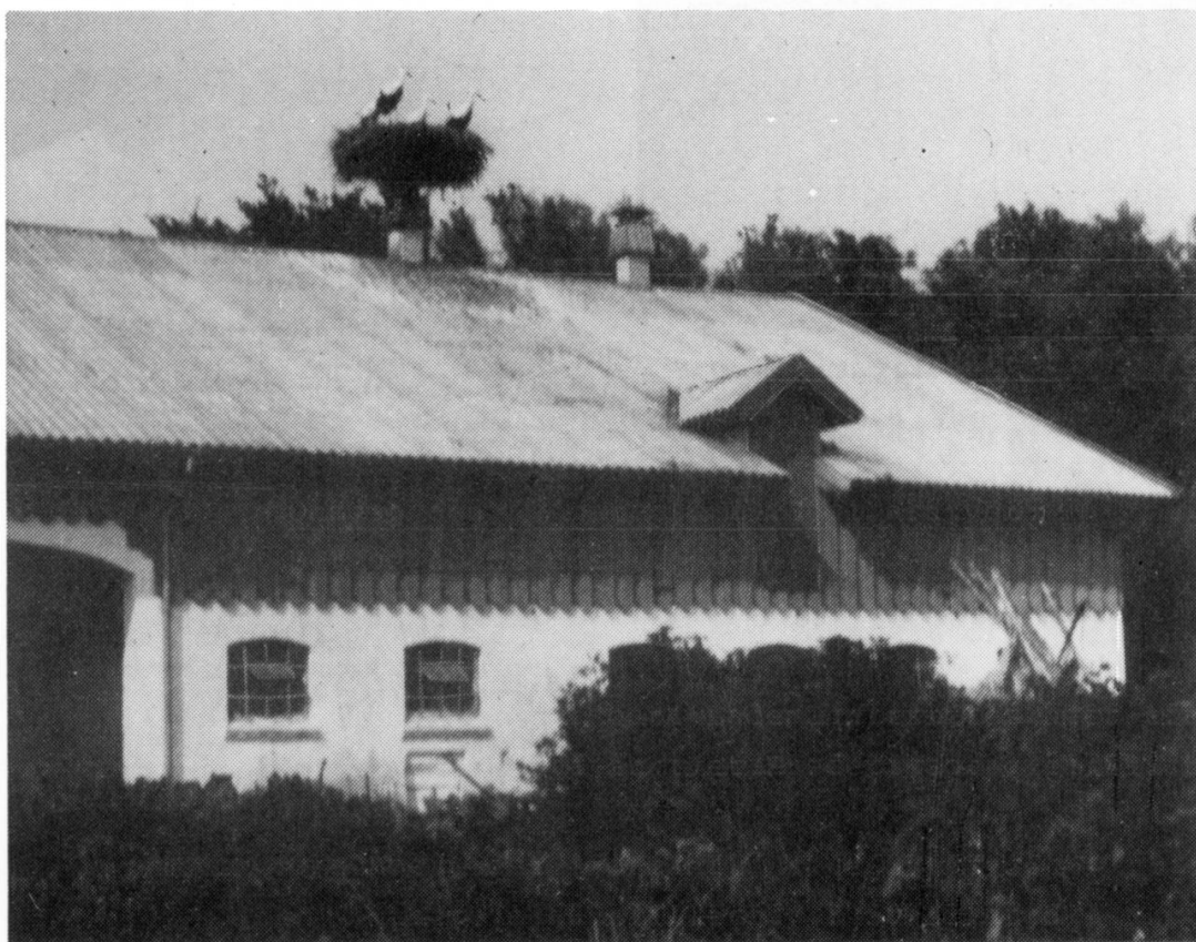
Storkefamilien på Blovstrød Præstegård kunne tydelig ses fra Kongevejen

I tider, hvor storke- forlængst har forladt det sidste sjællandske hustag, er det ganske rimeligt at