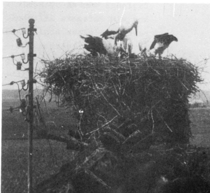
Storkereden på Kirkehavgård, 1927 Bemærk udsigten over Lillerød!

Det er om Kirkehavgårdstorken vi ved mest. Reden vides at være bygget i 1875 og var i brug til op mod 1950. Den lå på den gavl, som er nærmest kirken, og blev ganske stor med årene. For gårdens beboere var storken genstand for megen interesse og glæde, fra man i begyndelsen af april spejdede efter den første stork, til de voksne unger forlod reden om eftersommeren. Man påstår, at den første stork - altid hannen - ankom nøjagtigt 12. april. Man