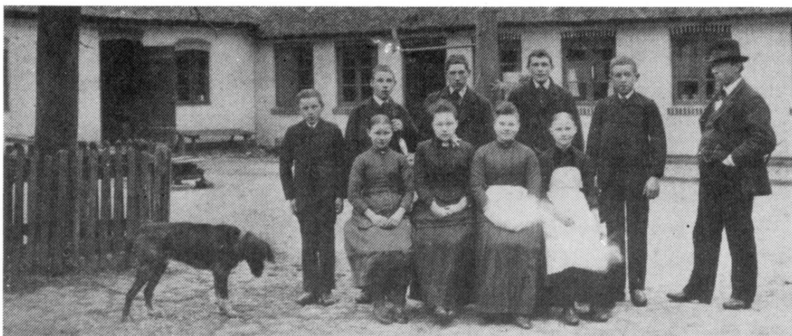
De enkelte husstande blev opført hver for sig. (Uggeløsegård ca. 1890)