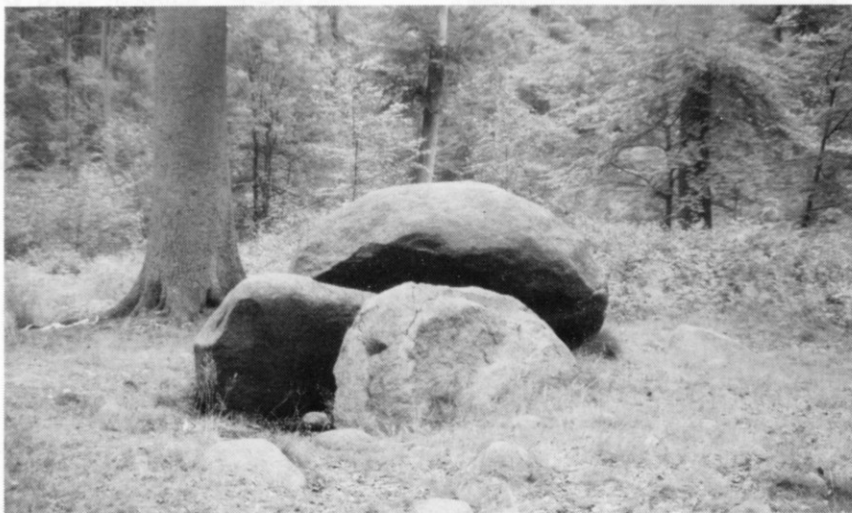
Runddysse (16) øst for Bavnebakke.

17. Ved Bavnebakke en høj , 13x0,5 m med mange mindre sten. Der er ingen spor af kammer.