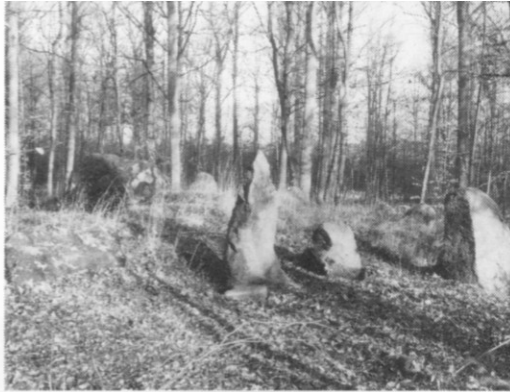
Langdysse (4) nær Blovstrød idrætsplads.

10. I gammel bøgeskov ved "Avlkarlevold" en velbevaret Langdysse , kaldet Firkammerdysse. 25x8x1 m, orienteret NNØ-SSV. Der ses 30 randsten og hele 4 kamre, hvoraf det næstnordligste har stor kløvet dæksten, der nu ligger samlet efter restaurering. Det nordligste kammer orienteret på langs som dysse, de 3 andre på tværs. Alle 4 kamre ret store, fra 210 til 160 cm lange. Der kendes kun få dysser med 4 gravkamre.