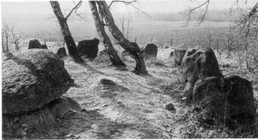
Kongedyssen (23) ved Dæmpegårdssletten.

(220x120 cm) er sat af 4 bæresten med en meget stor dæksten og man kan krybe ind i det 130 cm høje rum – hvad mange synes at have gjort gennem tiderne! Fr. d. VIIIs monogram er indhugget på indvendige side af den nordvestligste randsten, og Louise Danners (LD) findes i den