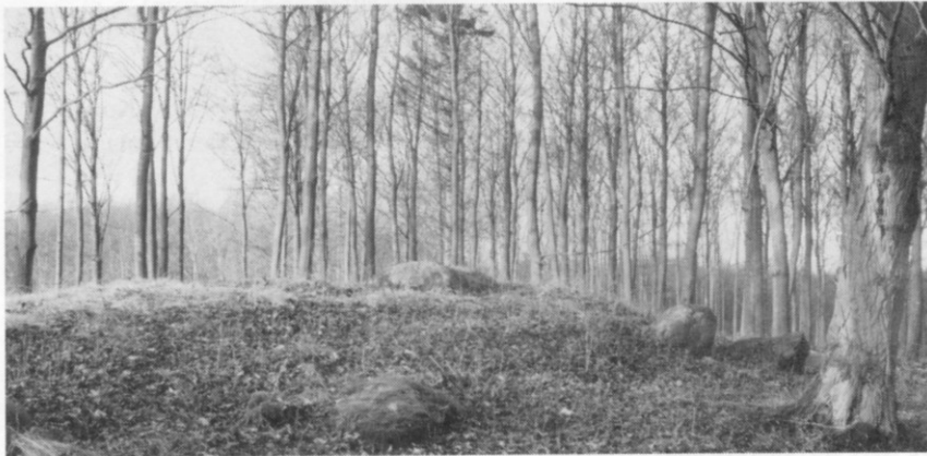
Langdysse (24) øst for lergraven, måske skovens eneste ikke-udgravede.

24. Øst for lergraven en Langdysse , 14x7x1,5 m orienteret N-S. 11 randsten, på højens top ses oversiden af en stor dæksten (200x130 cm) som