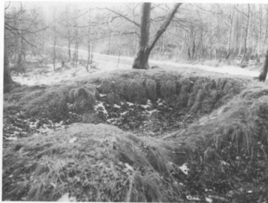
Langdysserest (1) ved Ejners Sti.

I oversigten har vi nummereret dysserne på egen måde, logisk i rækkefølge, hvilket ikke svarer til de andre, ikke publicerede registreringer.