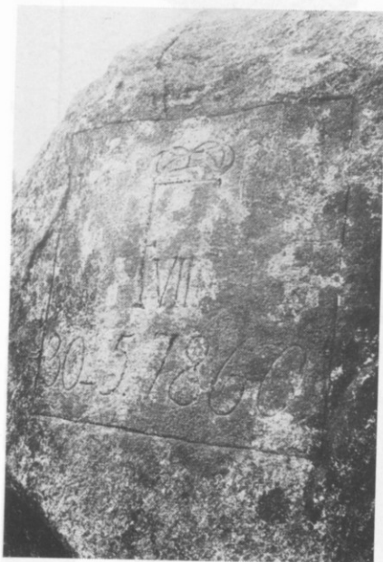
FR. VII's monogram på kongedyssen (23).