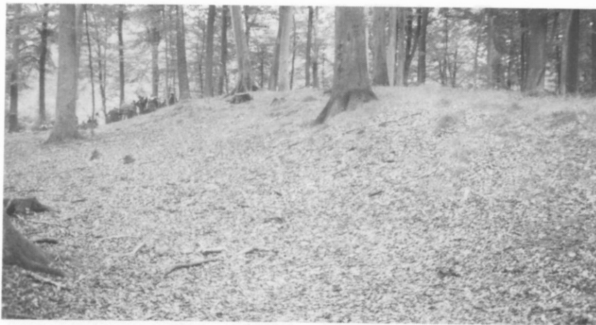
Den lange langdysse (20).

18. Ved Stumpedyssevej en uanselig høj uden sten.