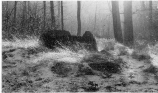
Runddysse (11) ved Degnebæksvej

16. Nordsiden af Stumpedyssevej i gammel bøgeskov, noget skjult af